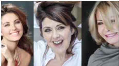
GRADISCA - domenica 14 gennaio ORE 21 QUESTE PAZZE DONNE