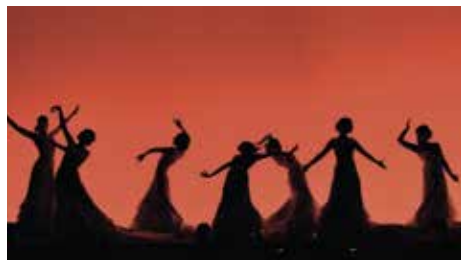
GRADISCA - venerdì 26 gennaio DANZA - ORE 21 BOLERO DE RAVEL ZAPATEADO DE MOZART FLAMENCO LIVE