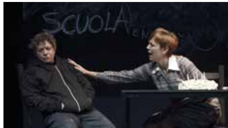
CORMONS - giovedì 18 e venerdì 19 gennaio FUORI ABBONAMENTO - ORE 21 CRONACHE DEL BAMBINO ANATRA