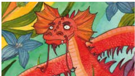
GRADISCA - domenica 21 gennaio SPAZIORAGAZZI - ORE 16 IL DRAGO ROSSO E L'ARCOBALENO